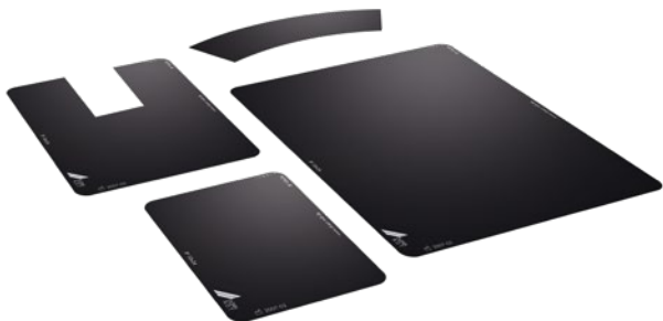
Plaque image DÜRR NDT avec la face active (blanche/bleue) vers le bas.

Les plaques images DÜRR NDT ont été conçues pour répondre aux besoins de l'industrie du CND avec différentes versions afin de couvrir l'ensemble des applications de radiographie.